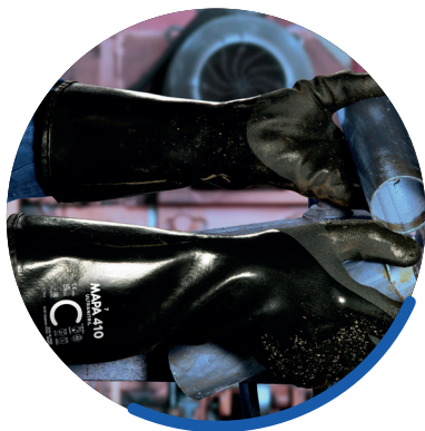
Lavorazione parti oleose